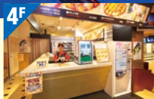
饮食角 Eating space