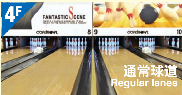
通常球道 Regular lanes