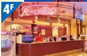
受理柜台 Reception counter